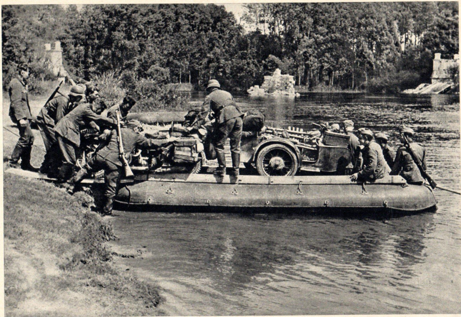
Über die Seine geht es nach Süden.