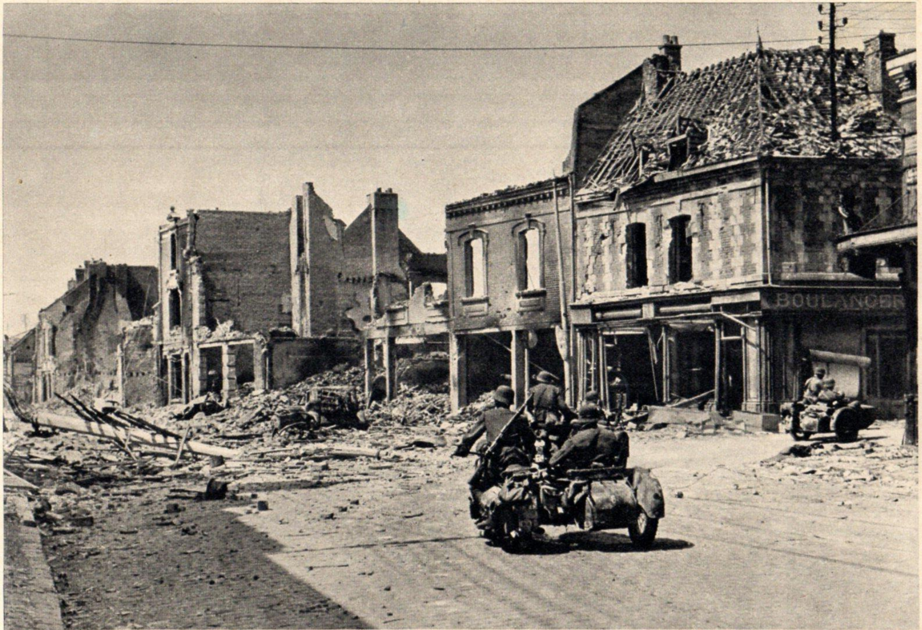
Der Brückenkopf Amiens wird gebildet.