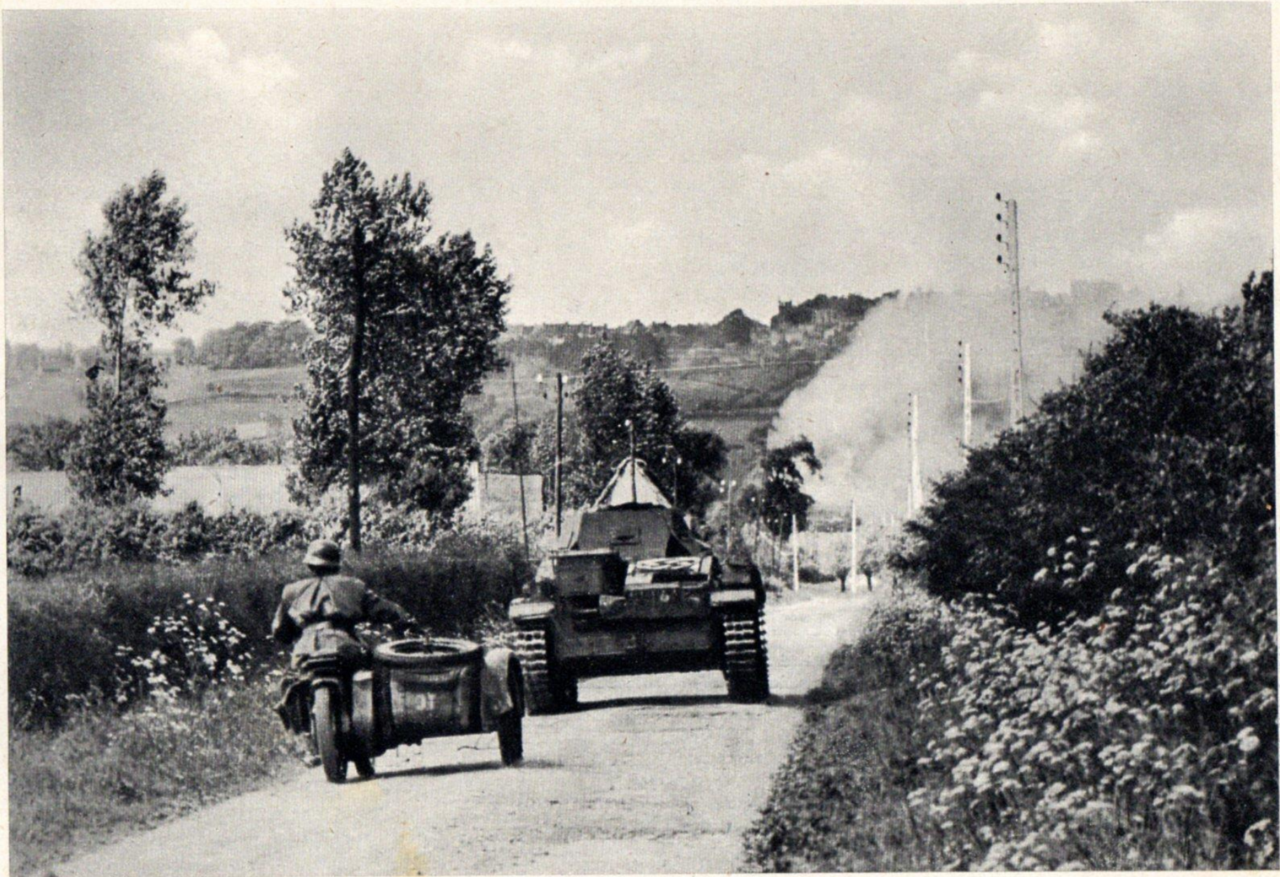
Die letzte Mulde vor Cassel.