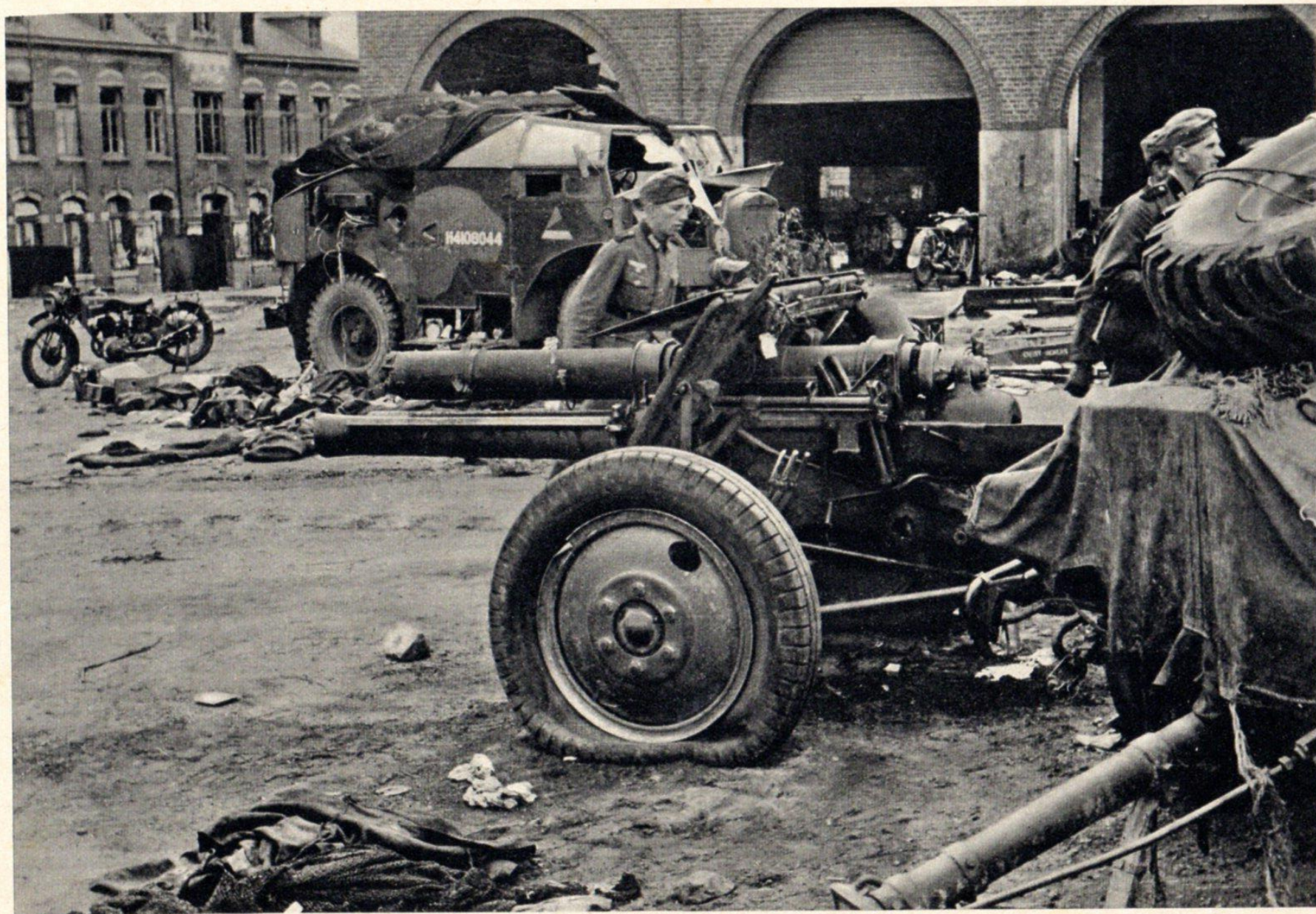
Castel . Marktplat.