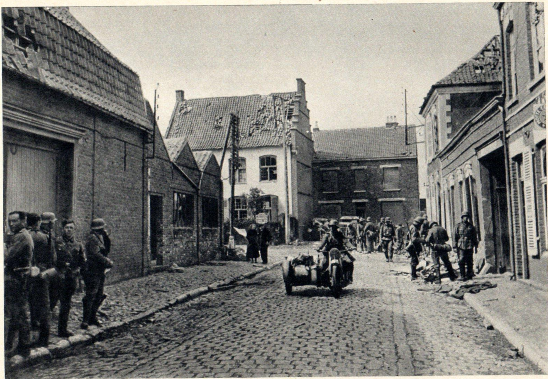
Нах дер Еннаhme eines flandrischen Städtchens.