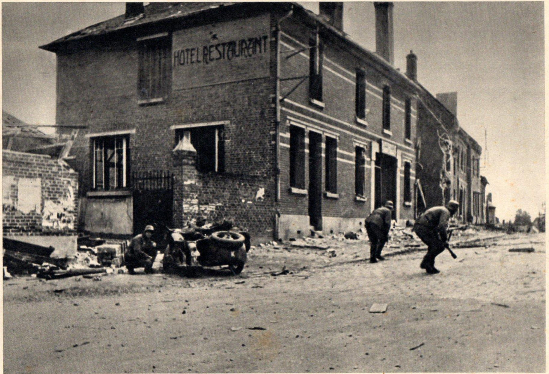
Immer wieder Ortshämpfe.