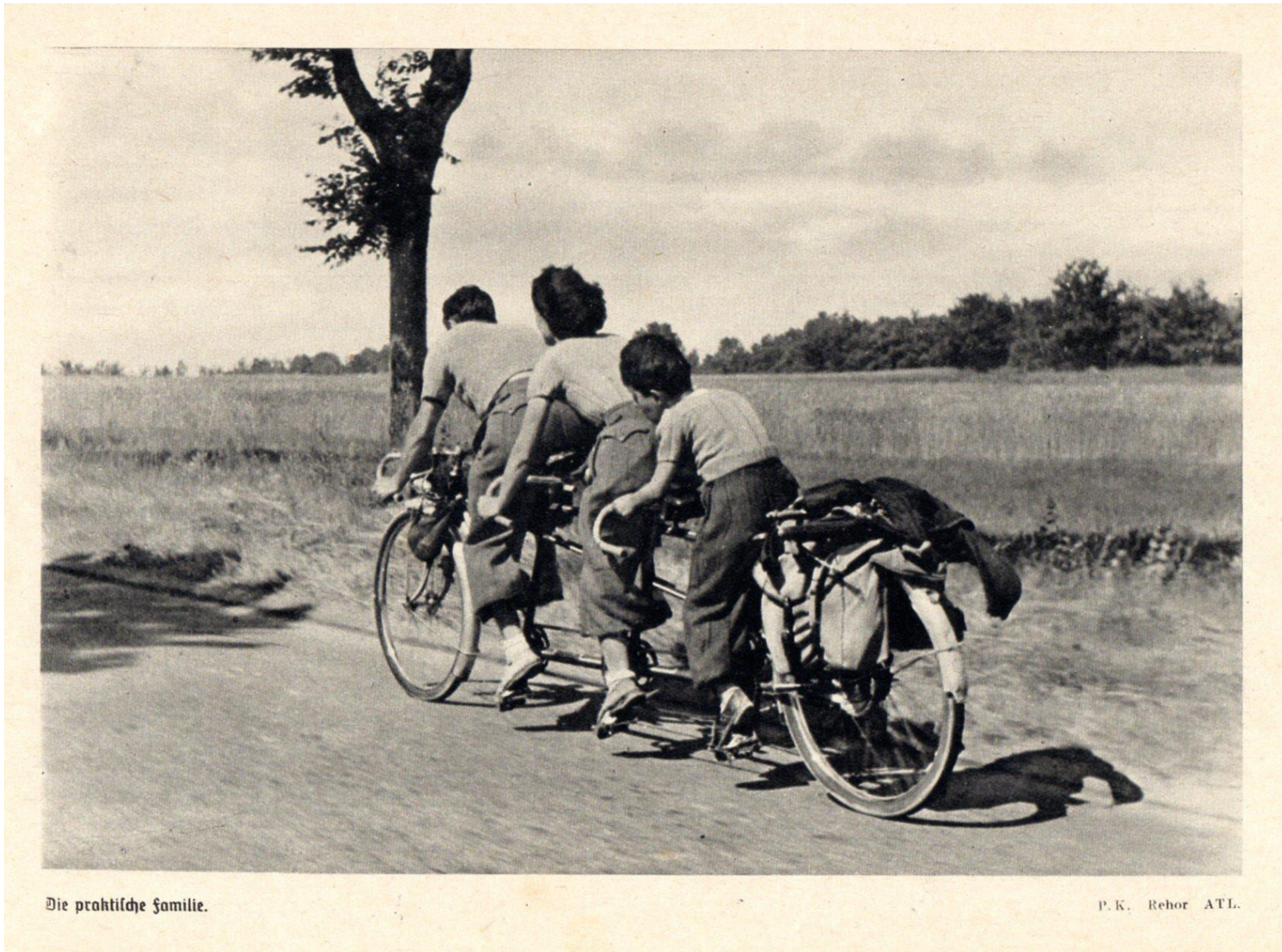
Die praktische familie.