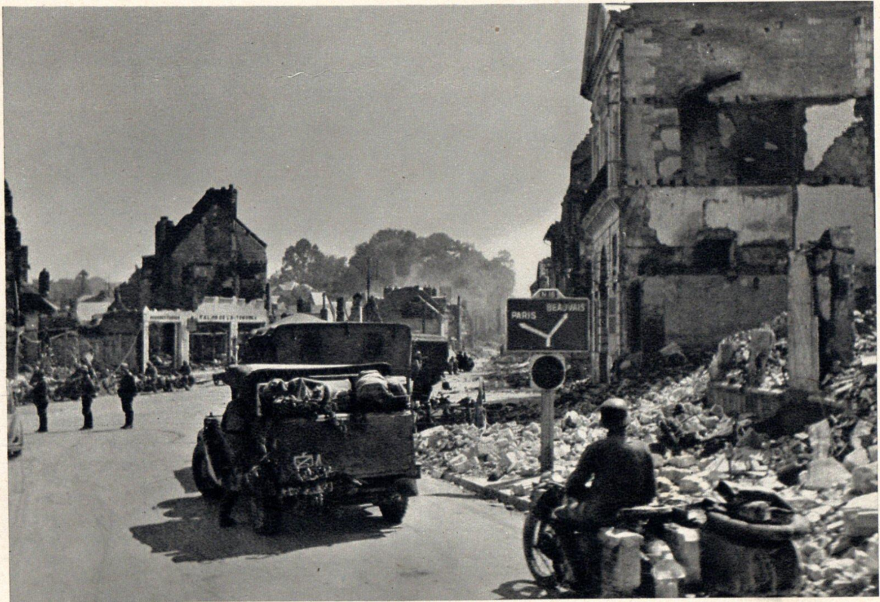
Die ersten Wegweiser auf Paris.