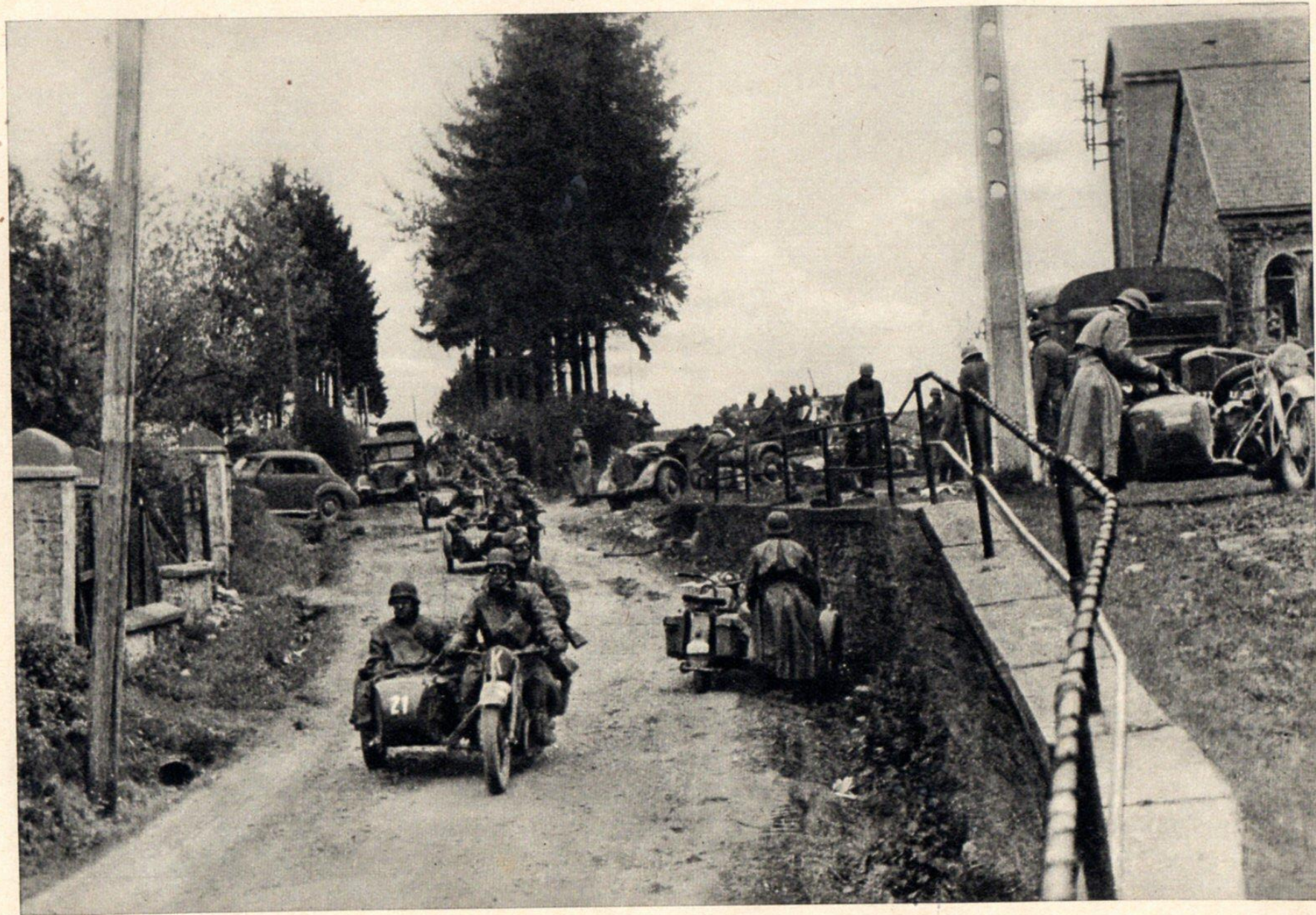
Aufklärungsabteilungen eilen voraus durch Südbelgien.