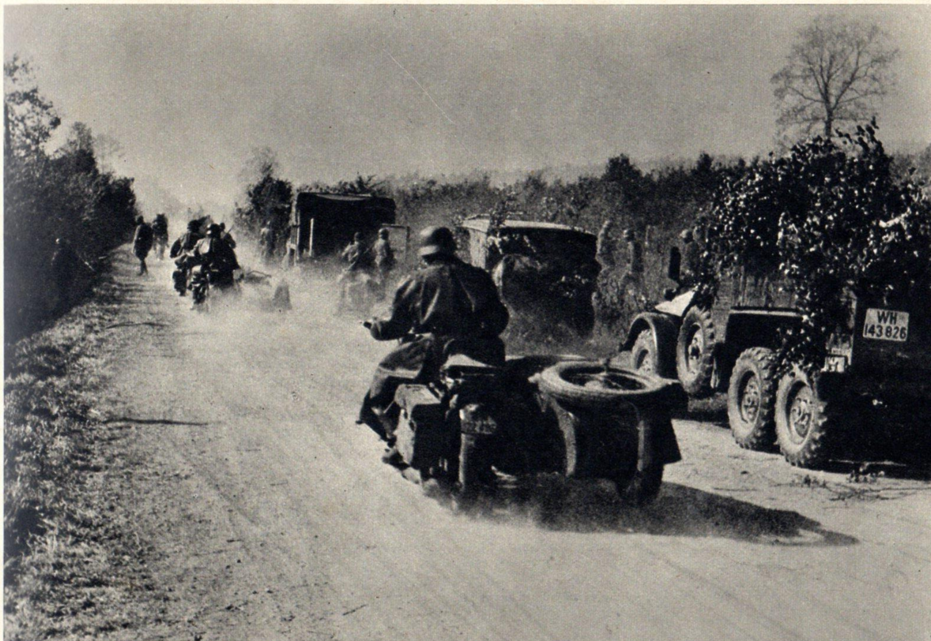
Radfahrer nach vorn.