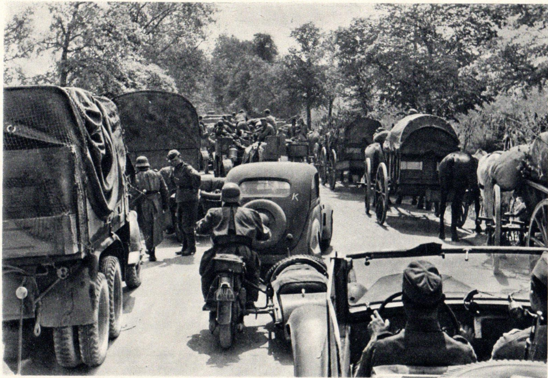
Umgruppierung, Kolonnen winden sich durch.