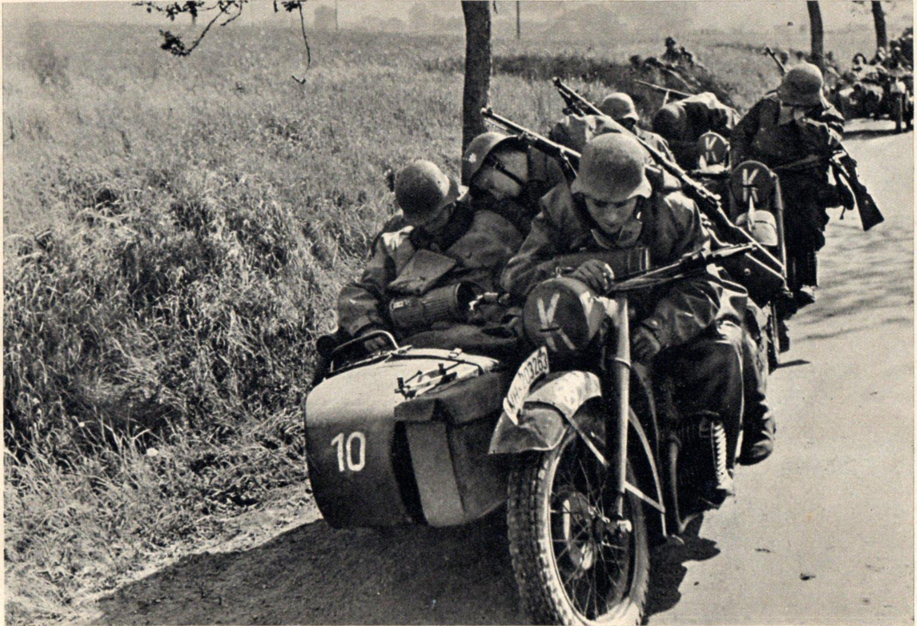
Ein Auge voll Schlaf.